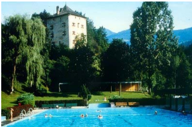
Freischwimmbad in Brixlegg

Im Winter sind auf Grund unserer zentralen Lage viele Schigebiete in kurzer Zeit erreichbar.